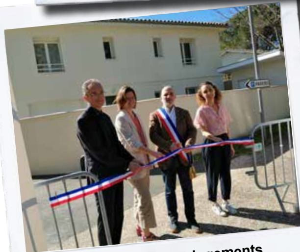
Inauguration des deux logements créés par la Commune dans l'ancienne Maison des Arts.