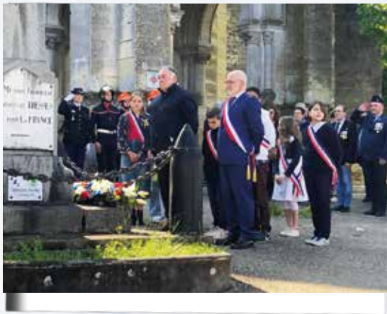
Commémoration de l'Armistice de la guerre 39-45 avec les membres du Conseil Municipal des Enfants.