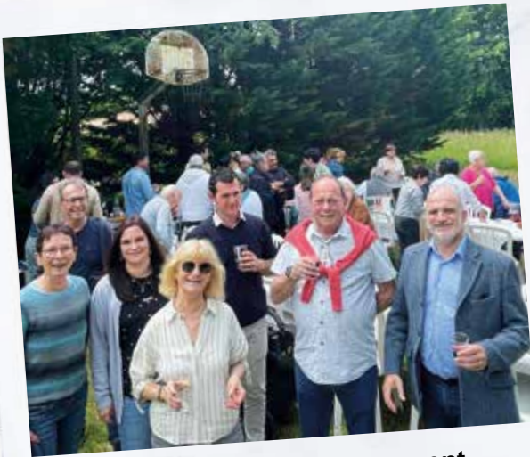
Les repas des voisins, un moment toujours convivial et de partage.