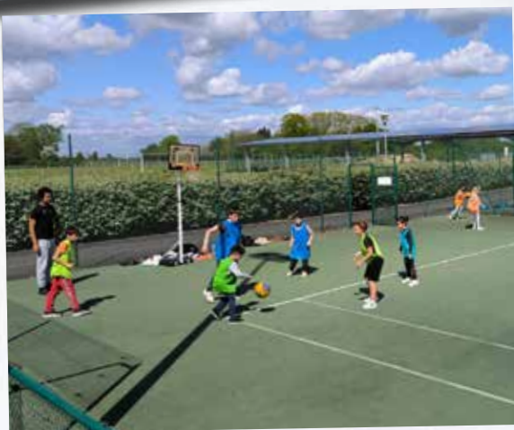
Les Centres de Loisirs à l'heure des Jeux Olympiques à la Plaine des Sports de Pétrus.