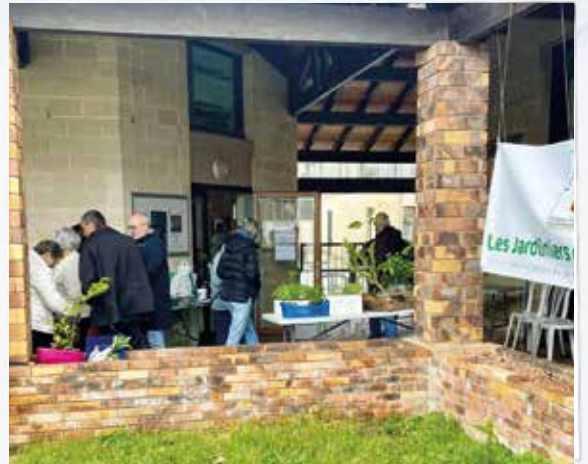
Troc Plantes à la médiathèque : des échanges et des discussions.