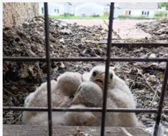
De jeunes faucons pèlerins grandissent dans le clocher de l'église.