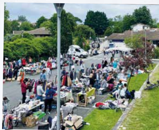
Le vide-grenier a de nouveau attiré de nombreux curieux et acheteurs.