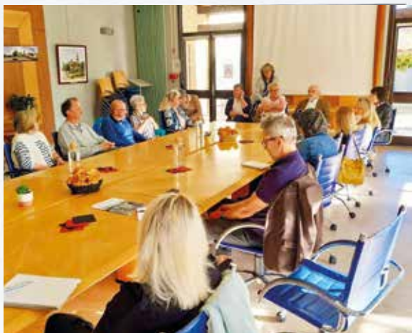
"P'tit déj citoyen" : les Tressois tirés au sort échangent avec M. le Maire autour d'un café/croissant.