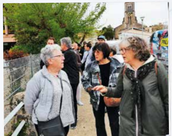
Accueil des nouveaux habitants et visite de la commune.