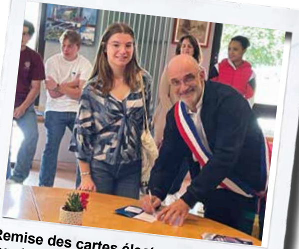
Remise des cartes électorales et des livrets du citoyen aux jeunes votants pour la première fois.