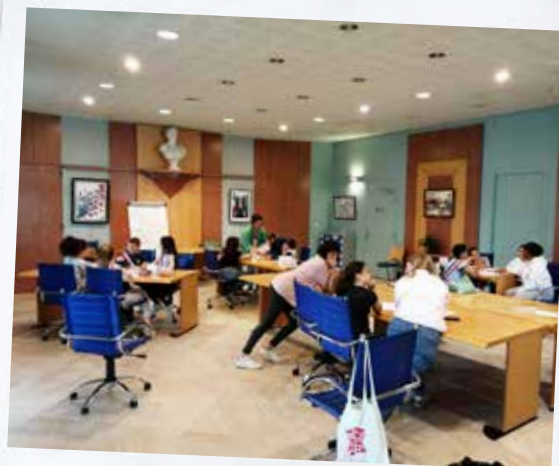
Les élèves élus au Conseil Municipal des Enfants en pleine séance de travail.