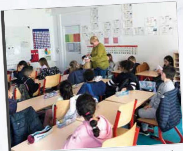
Remise des bonnets offerts par la Mairie aux élèves qui vont prendre des cours de natation à la piscine de Cenon.