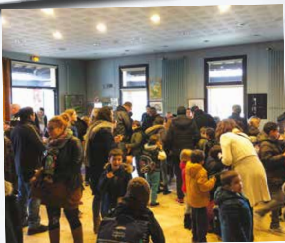
Chandeleur à la Mairie pour le bonheur des gourmands !