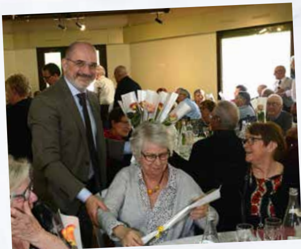
Repas des Anciens et fête des grands-mères : une fleur pour chacune