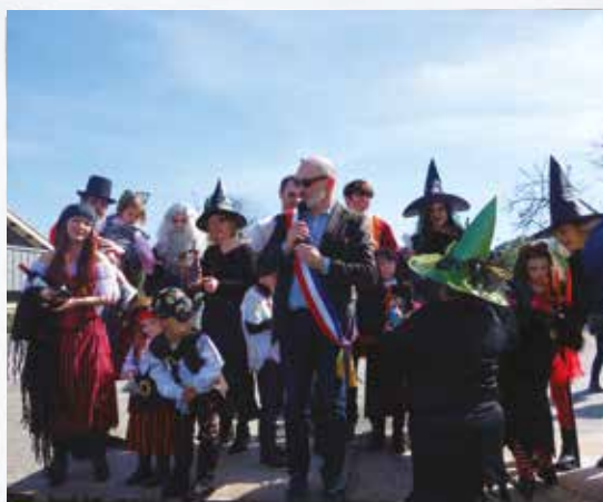
Carnaval : remise des prix aux gagnants du concours de déguisement