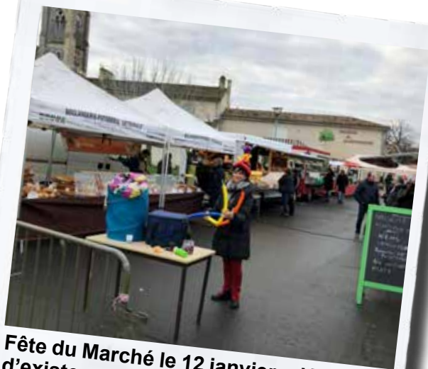
Fête du Marché le 12 janvier : déjà 15 ans d'existence !