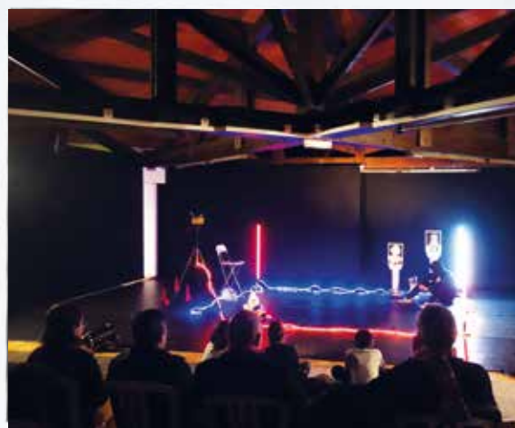
Spectacle les Tantalides, entre figures mythiques et contemporaines