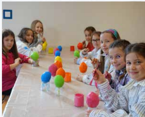
Les enfants de l'école élémentaire en pleine fabrication des leurres de la Chasse aux Oeufs de la Séguinie.