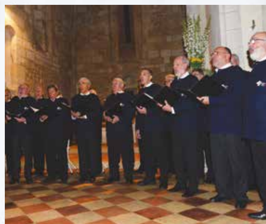
Chants basques dans l'église par le chœur d'hommes Etxekoak