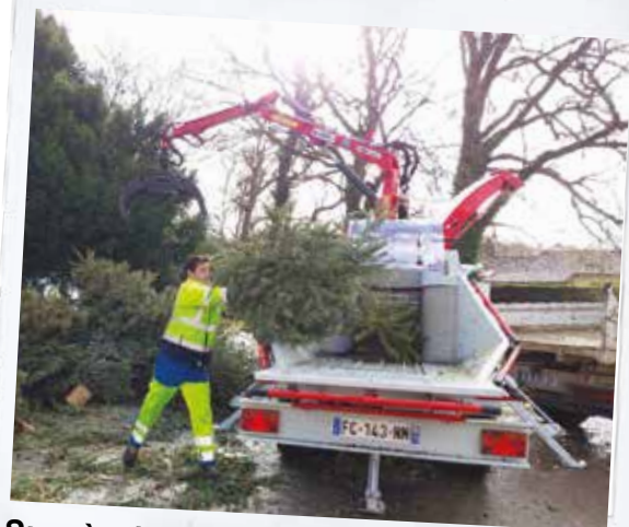
Succès de l'opération de dépôt de sapins de Noël : 460 sapins broyés. Le broyat sera utilisé dans les massifs publics.