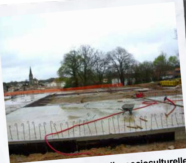
Les travaux de la salle socioculturelle avancent et la chape a été coulée.