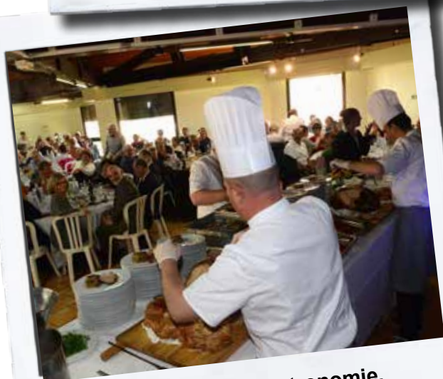
Repas des Anciens : gastronomie, convivialité et bonne humeur