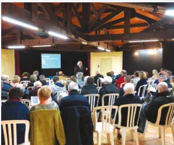
Grand Débat National à Tresses le 22 février sur la transition écologique. Compte rendus sur www.tresses.org